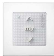
SMOOVE Commande à ajouter